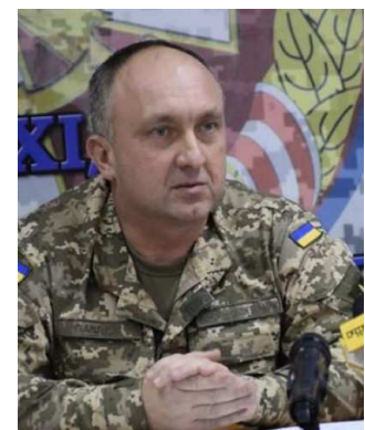
Павлюк Олександр Олексійович генерал-лейтенант (з 28.07.2021)