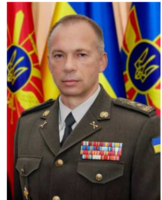
Сирський Олександр Станіславович генерал-лейтенант (06.05.2019 – 05.08.2019)